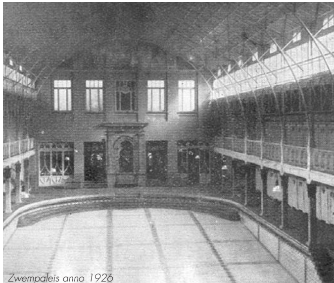
Zwempaleis anno 1926

is intussen naar het Stadsbestuur vertrokken. Reacties kan je kwijt op ons re(d)actieadres: Willem Herreynsstraat 29 • 2800 Mechelen, of op vanonderuit@skynet.be