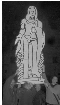
RIM in actie tegen monumentenverhuizing met een verplaatsbare, uitleenbare kartonnen Margaretha...

Op de Schoenmarkt stootten de stadsdiensten op nutsleidingen terwijl ze de voorbereidingen wilden treffen voor een (definitieve?) betonnen sokkel voor Margriet. Daar bestaan toch plannen over? Wedden dat men bij werken in het jaar 2025 op de langste bierleiding ter wereld stuit?