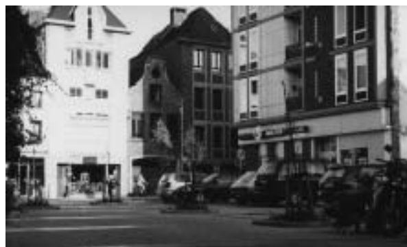
Koning auto staat er al. Nu nog een plaatsje zoeken om te zitten...

Je kan er niet meer naast kijken: het Mechels stadsbeeld verandert grondig. Straten worden omgeploegd en er verschijnt een wegdek dat de binnenstedelijke autogebruiker met zware voet (foei!) hopelijk zal doen nadenken. Maar of de vernieuwde pleinen onthaastend werken, daar heb ik weeral vragen bij... Hopelijk zullen de Italianen die de Grote Markt bovengronds zullen aanpakken niet karig zijn met zitelementen, ook al consumeren we niets... Terzijde maar niet minder intensief worden besparingsmaatregelen (waaronder afschaffing