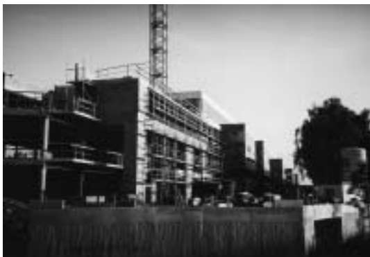
De open ruimte volgebouwd. Wie zal de leegstand aan de volgende generaties uitleggen?