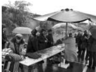
regenweer of niet: elk initiatief brengt volk op de been

Het buurtcomité Caputsteen wil vooral werken rond • het bevorderen van het sociaal contact tussen buurtbewoners • buurtverfraaiing • verkeersveiligheid (zie vraag om in bepaalde straten de snelheid af te remmen) • het informeren van buurtbewoners en het zoeken naar oplossingen voor problemen.