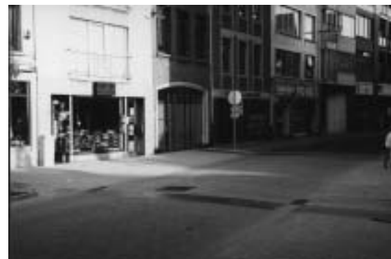
Eindelijk veilige schoolomgevingen!

Wim Dewit, motor van het buurtcomité Geerdegemvaart-Brusselsesteenweg, verzocht het Stadsbestuur nog maatregelen te nemen tegen het snelverkeer (Brusselsesteenweg) en het resterende zware verkeer (Europalaan) doorheen de wijk. Ook over de viaduct die de