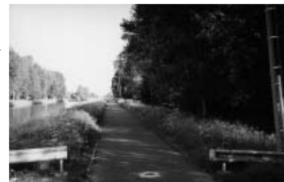
Stuivenberg: de strijd om deze open ruimte is niet nieuw

Structuurplan Mechelen tot stand kwam en hoe deze gefaseerd is, beet bewoner Leo Vivijs de spits af met een eerste reeks vragen. Voor hem is het behoud van Stuivenberg als enig overblijvend agrarisch gebied een prioriteit. De verkaveling en de bouw van 500 woningen