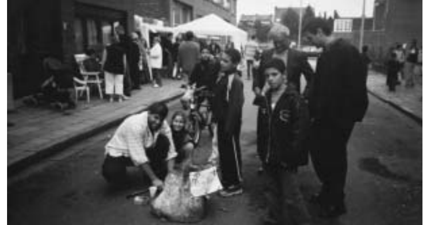
Culinair open-straat-dag in de buurt Pennepoel

Een tweetal jaren geleden werd een buurtcomité opgericht met als hoofdojectieven: verkeersveilige straten en de bewoners terug met elkaar te laten kennismaken om het individualisme te weren. "t Bergske", een groen pleintje in onze wijk, ligt er vandaag verwaarloosd bij. Ook het voetbalpleintje "de twee goalen" ligt in een erbarmelijke staat. Graag zouden wij deze plaatsen terug mooi willen zien waar het aangenaam vertoeven is voor volwassenen en kinderen.