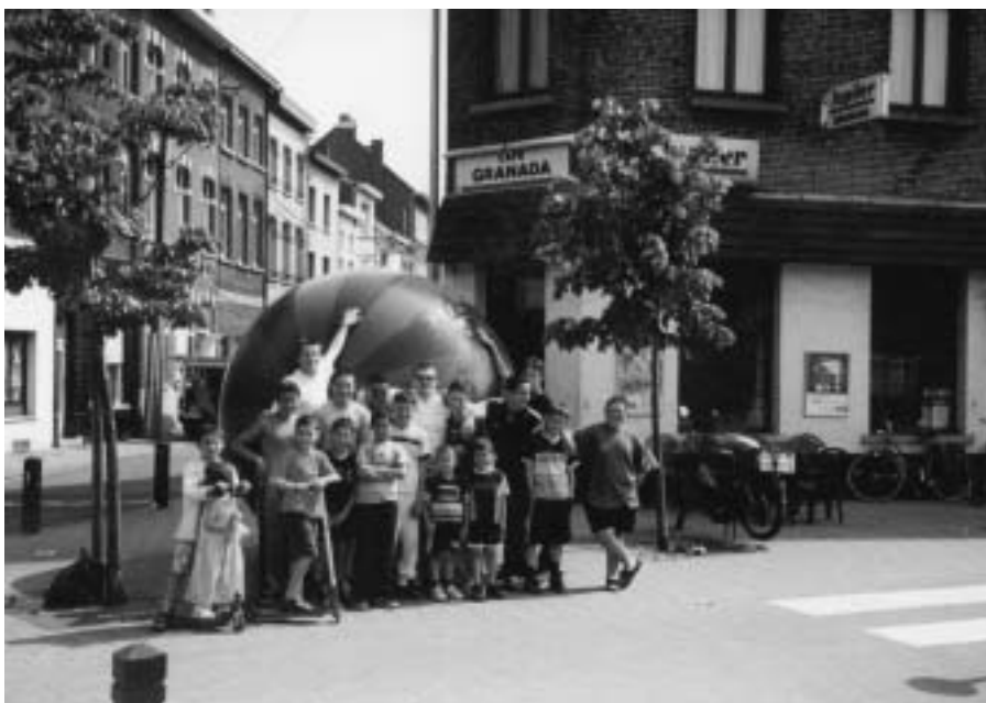
Een wijk waar gewerkt wordt aan een multiculturele samenleving.

■ Tot slot vindt het buurtcomité Leuvensesteenweg het een zeer spijtige zaak dat de Stad Mechelen kiest voor de aanleg van nieuwe banen met viaducten en een bypass om het mobiliteitsprobleem op te lossen.