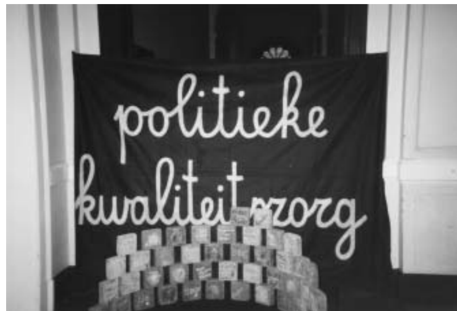
Inspraak vanonderuit opbouwen

In een volgende vanonderuitkrant leest u meer over de getuigenissen van de