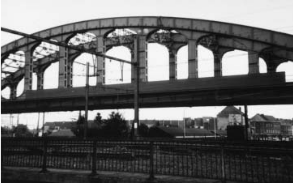
Wij willen een leefbare woonbuurt en geen ghetto!

Het Buurtcomité Leuvensesteenweg wil hierna de aandacht vestigen op een aantal problemen waarmee hun buurt in de toekomst zal geconfronteerd worden: