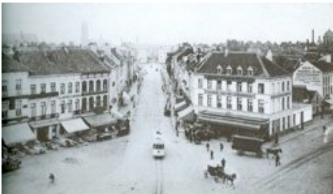
Tram 52 richting Centrum en verder via H.Consciensestraat anno 1955

De vraag rijst of men de bereikbaarheid nog langer door de autobril kan bekijken als men het over duurzaamheid wil hebben. De besturen willen tegelijkertijd duurzaamheid én bereikbaarheid, en dus blijft men de auto aanzuigen tot dicht bij de stations, de bedrijvensites (Mechelen-Noord, ontwikkeling aan de ring R6, Raghenopark, stationsomgeving, ...) én de kernstad. Het resultaat kennen we.